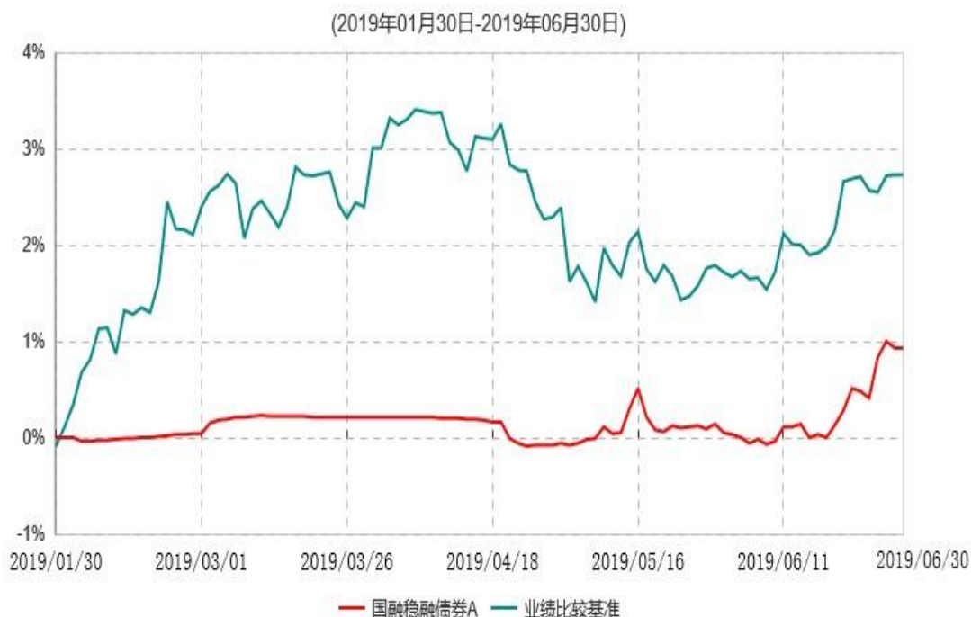
国融稳融债券A累计净值增长率与业绩比较基准收益率历史走势对比图