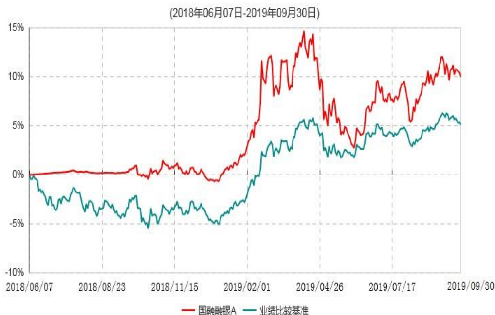
国融融银A累计净值增长率与业绩比较基准收益率历史走势对比图