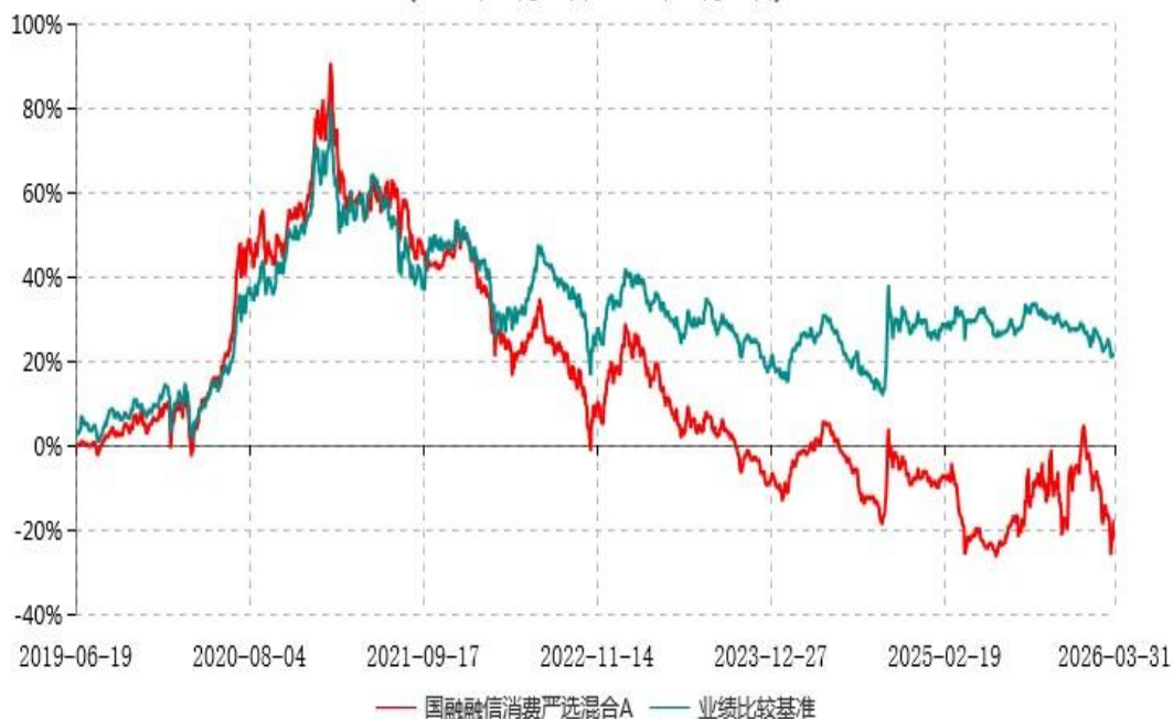
国融融信消费严选混合A累计净值增长率与业绩比较基准收益率历史走势对比图 (2019年06月19日-2026年03月31日)