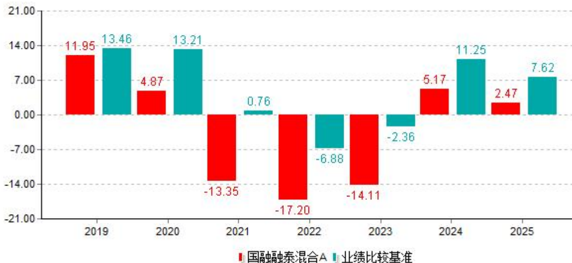
基金的过往业绩不代表未来表现；数据截止日：2025年12月31日 单位%