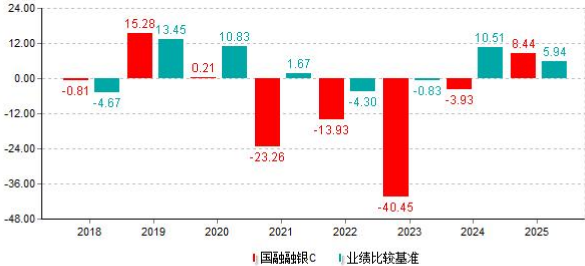
基金的过往业绩不代表未来表现；数据截止日：2025年12月31日 单位%