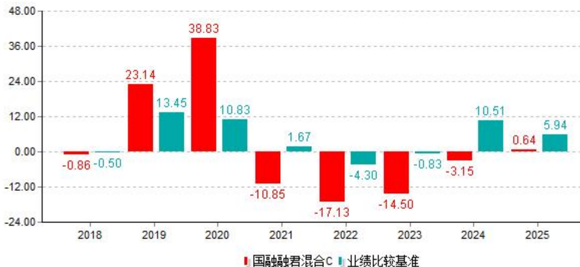
基金的过往业绩不代表未来表现；数据截止日：2025年12月31日 单位%